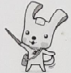
横浜市資源循環局マスコットイーオ